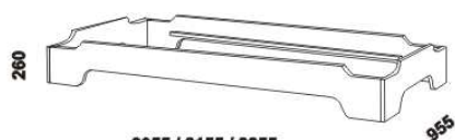
2055 / 2155 / 2255 postel TWIST 90 x 200, 210, 220

Provedení: masiv – cink. Tloušťka materiálu postele: 27 mm. Další dřeviny na dotaz: borovice, bříza, dub, jasan, javor, olše, ořech, smrk. Povrchová úprava: olej nebo dvousložkový vysoce odolný polyuretanový lak.