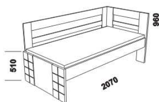
990 / 1290 postel HANNY II. 90, 120 x 200